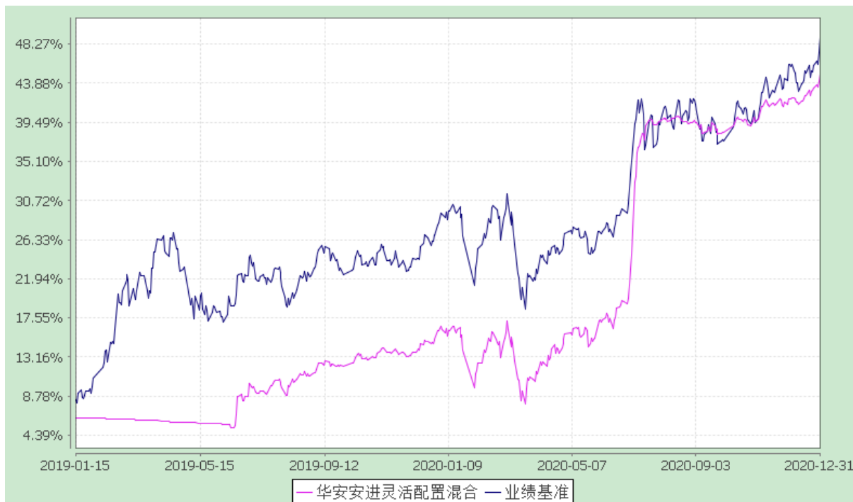
自基金转型以来份额累计净值增长率与业绩比较基准收益率的历史走势对比图 (2019 年 1 月 15 日至 2020 年 12 月 31 日)